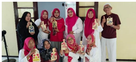
Gambar 3. Peserta pelatihan Kriya

Memberikan ruang ekspresi emosi melalui seni sebagai terapi untuk mengolah perasaan negatif, dan juga untuk meningkatkan kualitas hidup.