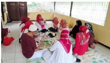
Gambar 1. Kegiatan pelatihan Kriya dan bahan baku bambu

Sasaran Utama, peserta di masa purna bakti dan peserta di usia masa pensiun, berusia 65-80 thn, Pecinta kerajinan kriya dan ingin self healing . Sasaran Sekunder, Peserta umum mulai remaja sampai dewasa yang tiap harinya selalu disiapkan dengan targetan kerja dan membutuhkan self healing .