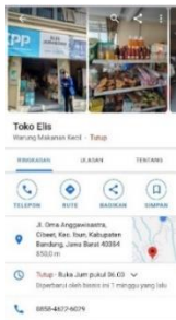
Gambar 7 Hasil Pendaftaran - Toko Elis

Dalam melakukan pendaftaran UMKM di Google Maps dari tanggal 14-19 Agustus kita sudah mencapai 20 usaha yang sudah terdaftar di Google Maps.