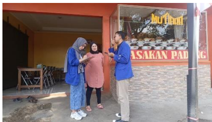
Gambar 2 Melakukan Pendataan Usaha