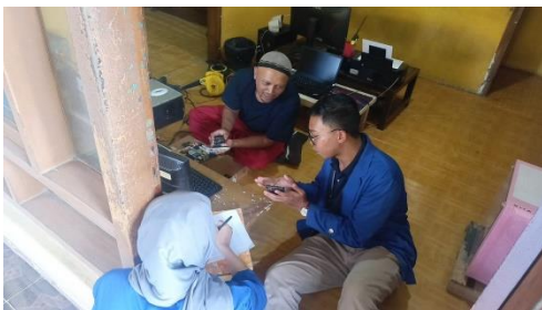
Gambar 5 Melakukan Pendampingan

Setelah melakukan survey, pendataan, dan pendaftaran. Maka tahap selanjutnya adalah pendampingan, dimana pendampingan ini bertujuan agar pelaku usaha bisa mengelola usahanya di Google Maps, seperti upload menu produk yang dijual, foto produk yang dijual, dan melakukan respon pada ulasan.