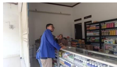
Gambar 3 Survey Pelaku Usaha UMKM

Seperti yang dijelaskan pada metode pelaksanaan di atas. Maka dalam melakukan pengabdian ini kegiatan pertama yang kita lakukan adalah melakukan kegiatan survey. Kegiatan survey ini kita lakukan dengan berkunjung secara langsung kepada pelaku usaha kecil dan menengah (UMKM) yang terletak di Desa Cibeet Kecamatan Ibun. Untuk memudahkan komunikasi, survei ini dilakukan secara door-to-door dengan pelaku usaha serta lebih mengetahui terkait masalah yang sering mereka alami dan belum menemukan solusi.