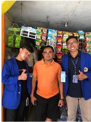
Gambar 4 Foto Bersama Pelaku Usaha

verifikasi akan dikirimkan melalui email yang didaftarkan.