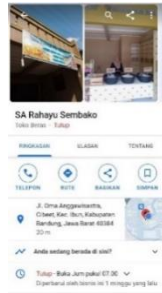
Gambar 6 Hasil Pendaftaran - SA Rahayu

Untuk mencapai tujuan kegiatan dalam meningkatkan visibilitas dan penjualan dengan memanfaatkan Google Maps, ada 4 tahap kegiatan yang dilakukan, yaitu: