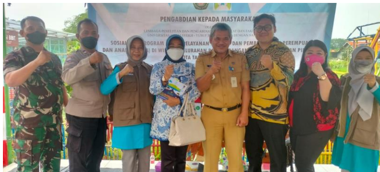
Gambar 7. Foto Bersama Peserta